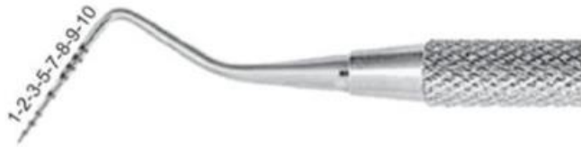
Resim-1: Williams Periodontal sonda